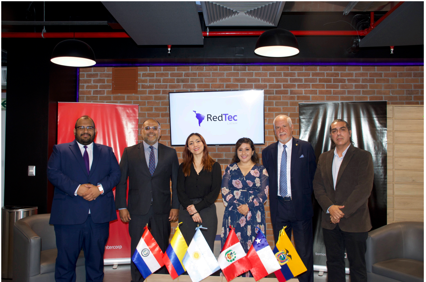
Representantes de Instituciones miembro de RedTec-LATAM

A través de esta iniciativa regional, RedTec-LATAM busca fortalecer las alianzas interinstitucionales para fomentar la educación técnica en la región como una alternativa clave que pueda responder efectivamente a un mercado laboral dinámico. Este objetivo será posible a través de la cooperación de investigación aplicada , la publicación de trabajos interinstitucionales , la colaboración en proyectos estratégicos , así como la realización de conferencias y congresos internacionales que tengan un enfoque académico y empresarial.