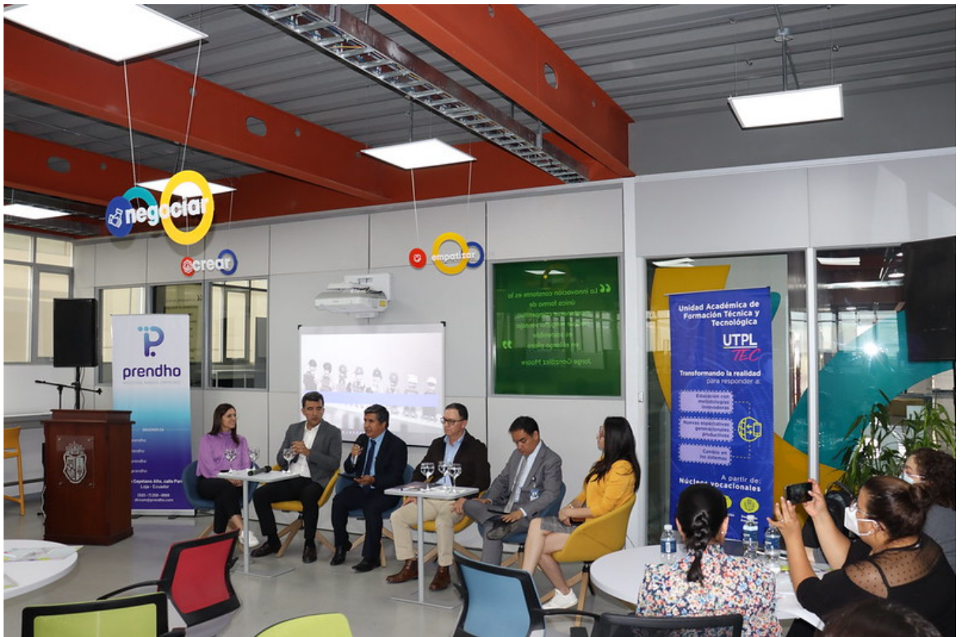
Miembros de panel de experiencias