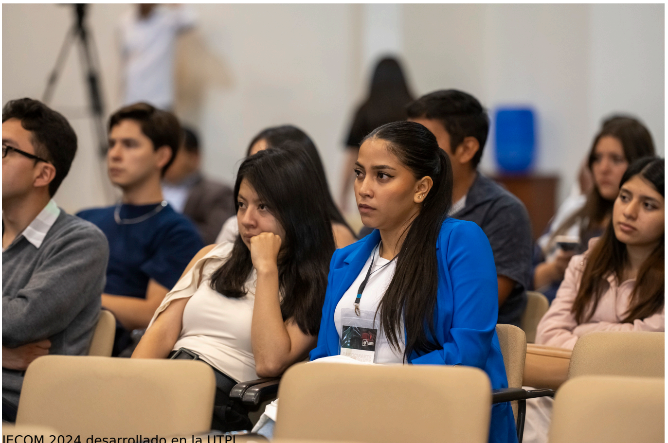
IECOM 2024 desarrollado en la UTPL.